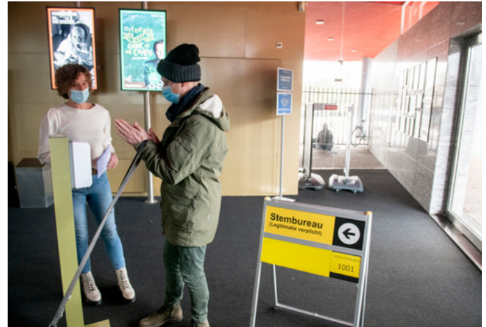
Rol van gastheer/gastvrouw kan van grote meerwaarde zijn.