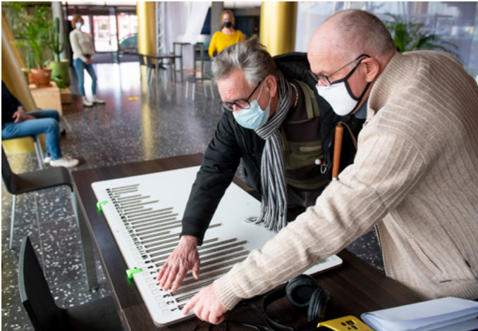
Hulp van stembureaumedewerker is mogelijk.

De rol van stembureaumedewerkers is erg belangrijk bij het stemmen. Zij moeten op de hoogte zijn van de mogelijke hulp en hulpmiddelen. Door daar op een juiste en prettige manier op te anticiperen, zal het stemmen, wat toch vaak spanning met zich meebrengt, zo soepel mogelijk verlopen. Dit verkleint de kans op een ongeldige stem.