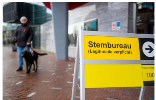
Duidelijke route aanduiding buiten en binnen.

Op de stempas staat vermeld waar de dichtstbijzijnde stemlocatie is, maar de kiezer mag zelf een locatie binnen de gemeente kiezen. Het is voor iedereen verschillend of een stemlocatie toegankelijk is of niet. Dit hangt af van de voorzieningen die er zijn. Zo heeft de ene kiezer baat bij een stemmal en een andere bij een goede bereikbaarheid met het OV. Het is daarom belangrijk als gemeente om per stemlocatie aan te geven welke voorzieningen aanwezig zijn, zoals bijvoorbeeld aanwezigheid van voelbare of zichtbare routegeleiding (binnen en buiten), bereikbaarheid met het ov en welke ondersteuning en hulp(middelen) beschikbaar zijn. U kunt dit aanvullen op de site waarismijnstemlokaal.nl/ van ministerie van Binnenlandse Zaken.