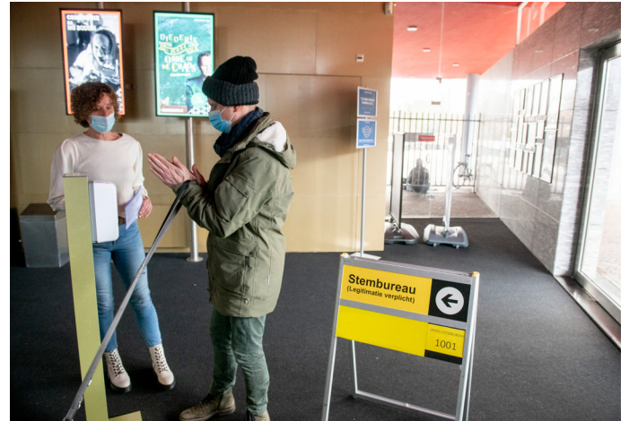
Rol van gastheer/gastvrouw kan van grote meerwaarde zijn.