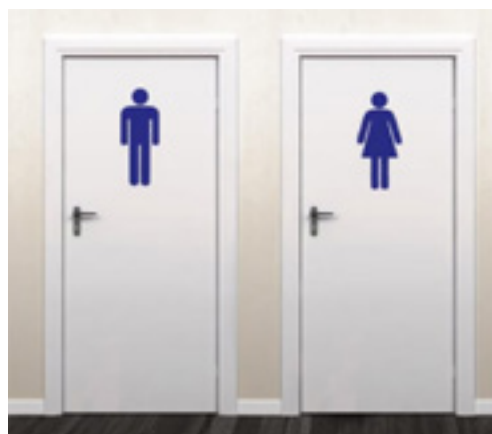
Afbeelding 2 - Toiletdeur met duidelijke en contrasterende iconen.