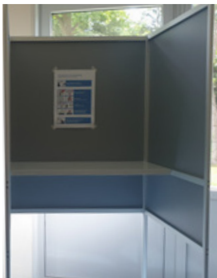
Afbeelding 4: Stemhokje, te donker zonder taakverlichting.