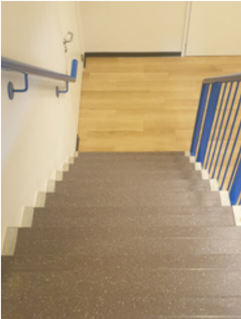
Afbeelding 8: Een trap zonder markering.