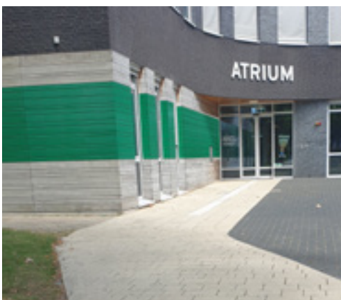
Afbeelding 1: Voorbeeld van een duidelijk zichtbaar pad naar de entree.