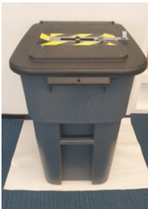
Afbeelding 11: Stembus met gemarkeerde gleuf en een aangebracht contrasterend vlak onder de bus.