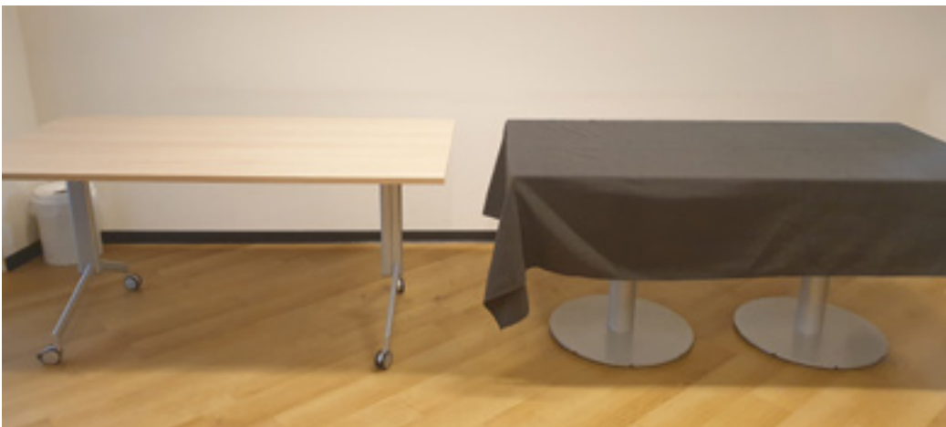
Afbeelding 10: Een donker meubel is beter zichtbaar tegen lichte achter- en ondergrond, en vice-versa.