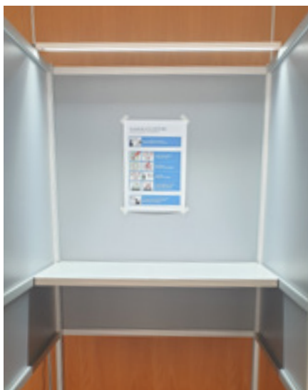
Afbeelding 3: Stemhokje met goed afgeschermd taakverlichting.