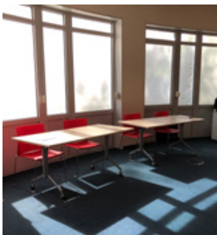
Afbeelding 6: Voorzitterstafel met hinderlijk daglichtinval.